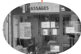
LA MAISON DES PASSAGES 44 rue Saint-Georges 69005 Lyon

PROGRAMME COMPLET www.itinerancestsiganes.com Facebook : Festival Itinérances Tsiganes