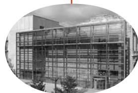
ARCHIVES MUNICIPALES 1 Place des Archives 69002 Lyon