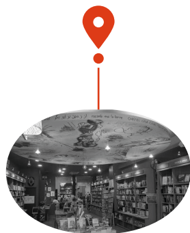
LIBRAIRIE RACONTE MOI LA TERRE 14 rue du Plat 69002, Lyon

L'existence du Festival repose sur la rencontre, la connaissance et le dialogue entre le monde du Voyage et les sédentaires, avec comme objectifs la reconnaissance et le respect de l'Autre. C'est par la connaissance de l'Autre que tombent les préjugés.